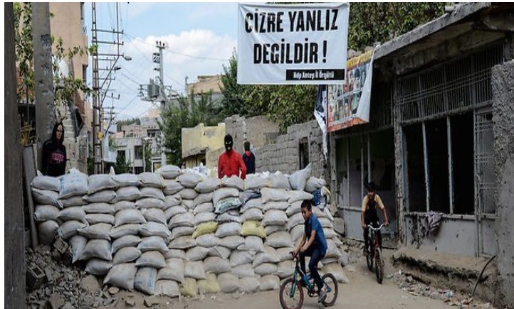
Le quartier de Nur a Cizre

★ Les co-présidents du Parti démocratique des Peuples, Selahattin Demirtaş et Figen Yüksekdağ, ont donné hier une conférence de presse le 2 novembre 2 :