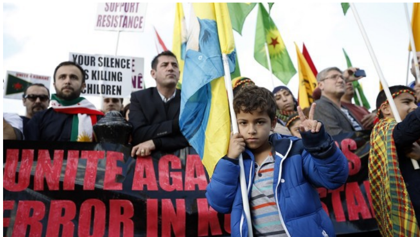
Manifestation à Londres